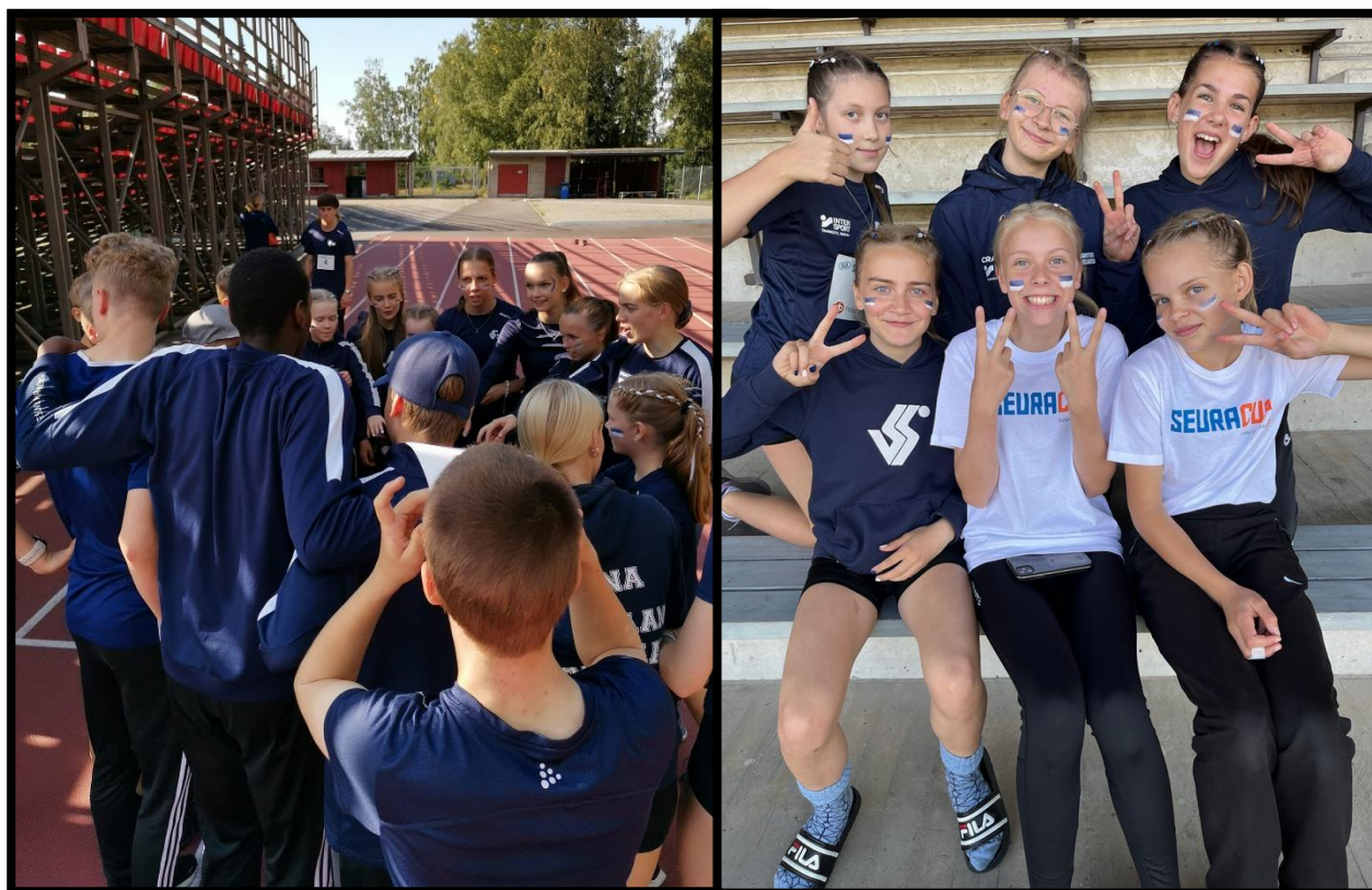
Joukkueen tunnelmia seuracupin c-sarjan finaalista Vaasassa 2.9. 2023.